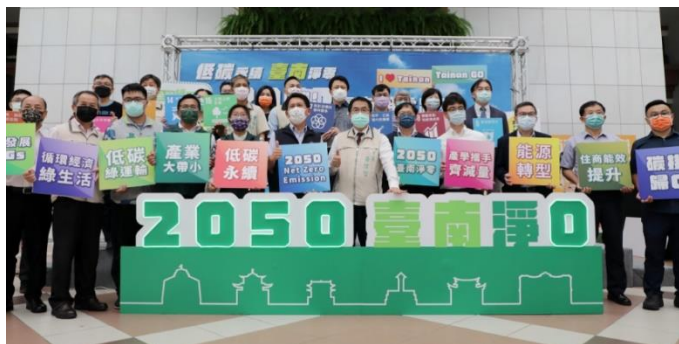
▲由Vincent執行副總經理(前排右三)代表出席，積極響應台南市府推動計畫

南茂積極參與台南市政府的號召，與台積電、聯電、台電、崑山科大、成大能源中心、遠東科大及南科管理局等產官學界專家組成「淨零輔導團」，主動出擊提供企業相關減量策略，形成另類產業互助合作的「減碳循環模式」。